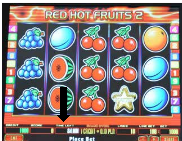
Przykładowa gra gdzie odmierzany jest czas.