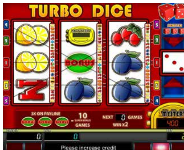
Przykładowy wygląd tzw. gry bębnowej