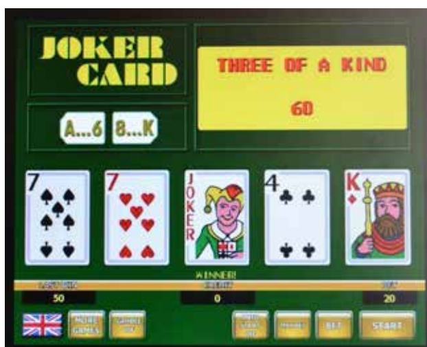
Przykładowy wygląd tzw. gry karcianej

wypadną w momencie zatrzymania kręcących się bębnow, co oznacza, że wyniki rozegranych gier zawsze pozostają dla niego nieprzewidywalne.