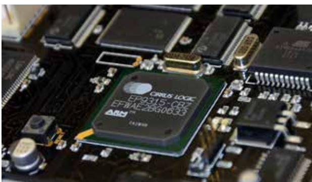
Generator liczb losowych

W przykładowej grze bębnowej przed rozpoczęciem gry gracz, za pomocą odpowiedniego przycisku, ustala stawkę za grę. Jednocześnie, wraz ze zmieniającą się stawką za grę, zmienia się tabela wygranych. Naciśnięcie przycisku uruchamiającego grę rozpoczyna grę – wizualizację obracających się bębnow z symbolami. Każda gra kończy się samoczynnym zatrzymaniem się bębnow. Gracz nie ma żadnej możliwości zatrzymania „bębnow”. To potwierdza, że wynik gry jest losowy, niezależny ani od jego woli ani od zręczności. Gracz nie ma wpływu na wybór symboli na bębnow. Tym samym nie ma wpływu na to, aby symbole ułożyły się w układ zapewniający wygraną. Nie ma także możliwości przewidywania układu symboli, jakie